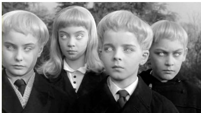
Fig. 4 - Village of the Damned (Wolf Rilla, 1960), screenshot