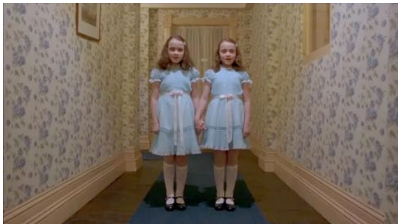
Fig. 8 - Shining (Stanley Kubrick, 1980), screenshot

Ciò che più ci interessa qui è lo spostamento dallo schema classico, per cui il Perturbante emerge dal transfert dal bambino all'adulto, a un modello ove il confronto con il lacaniano Grande Altro avviene tutto in un regime anagrafico cuccioloso, gli adulti non intervengono, se non come istanze emotive. Semplicisticamente le gemelline sono il vertice del male, e Danny quello del bene. Eppure la deriva ideologica è sapientemente evitata da Kubrick il quale riconduce surrettiziamente le due dimensioni valoriali alla responsabilità adulta, evitando di conferire ai valori uno statuto assoluto: delle sorelle si evince il perché del loro trapasso, grazie a inserti visivi che ne mostrano la macabra carneficina, così come della luccicanza di Danny si dà spiegazione come difesa nei confronti del padre sempre più vicino alla follia omicida. Così in questa scena si verifica una concrezione del tempo cristallizzato a metà fra analessi e prolessi - "fra soggettive reali e soggettive allucinatorie, fra inserti di immagini riferite al passato ( flashes back ) e [...] al futuro ( flashes forward )" (Bruno 2003, p. 56), ove l'interezza dei valori compresi nel range fra bene e male sono racchiusi nel corpo dei bambini, risposta passata e futura alla disennatezza degli adulti: "l'eterno ritorno dell'orrore è qui la coazione a ripetere i riti del dominio imperialistico, con il nucleo familiare come luogo di trasmissione forzata del super-io" (ibidem).