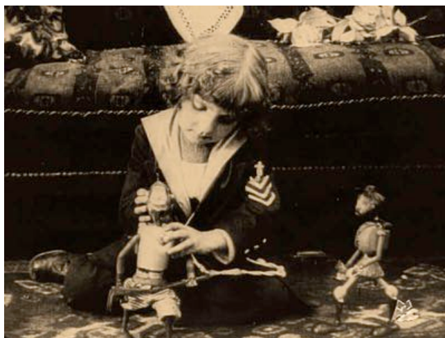
Fig. 12 - La guerra e il sogno di Momi (Segundo de Chómon, 1917), screenshot

Altra peculiarità saliente, di chiara impronta semiotica, è la spettacolarità visiva dei film dei cuccioli per i cuccioli. Dal mediometraggio di De Chómon, “con effetti di fantasia visiva inediti nello spettacolo italiano” (Faccioli 2016, voce “Pellicole sul fronte: il cinema e la guerra” in Dizionario storico della Prima guerra mondiale ), ai cartoni animati della Disney, la cui fantasmagoria visiva costituisce ancora oggi una firma, fino al cinema di derivazione spielberghiana con i suoi extraterrestri, archeologi con la frusta, squali, robot e dinosauri, la meraviglia e lo stupore innanzitutto visivo sembrano comporre il trigger capace di suturare il pubblico infantile, e non solo, al testo filmico. Se ne deduce che il primo aggancio, ancorché narratologico, è sempre intimamente sensoriale- estesico , basato su una sorta di dislocazione dell'immaginazione fanciullesca nell'immagine cinematografica, capace di assecondare ghiribizzi altrimenti relegati a fantasie che gli adulti, almeno agli occhi del bambino, sembrano non voler o poter capire sino in fondo. Così il cinema per ragazzi si fa persino dispositivo modale, capace di investire lo spettatore di un potere attanziale che è innanzitutto poter-vedere collettivamente una forma mediata – e