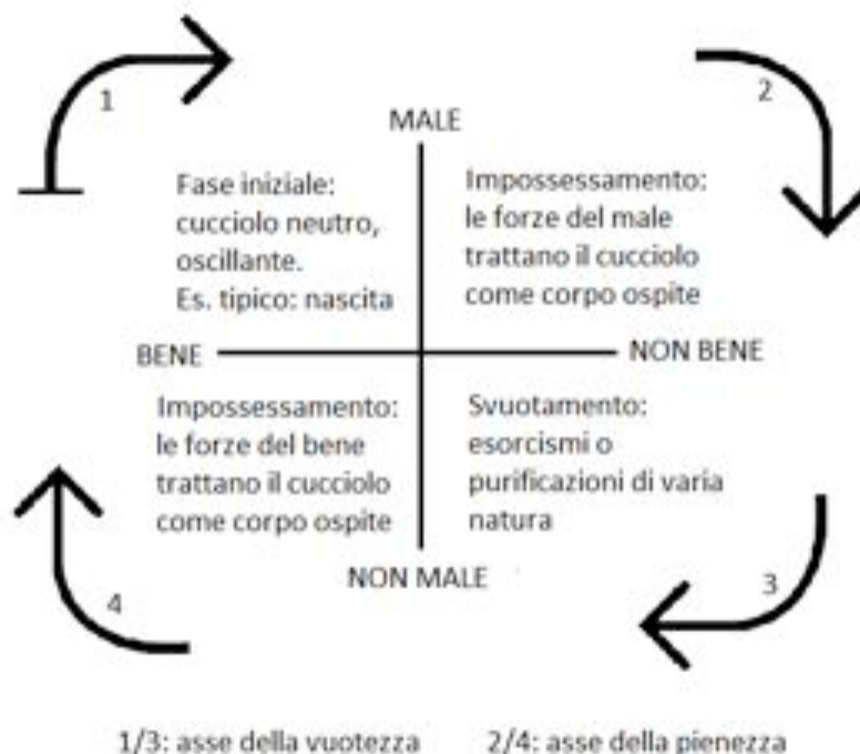
Fig. 11 - Mapping semiotico dell'assiologia bene/male con percorso narrativo (vuotezza e pienezza si riferiscono al fatto che il cucciolo è progressivamente svotato e riempito di assiologie durante la narrazione)

Nondimeno in sede semiotica è necessario constatare come l'arco narrativo delle storie che si stanno vagliando costituisca quasi sempre un percorso che, anche se diverso dalla retorica deamicisiana, porta agli stessi risultati. L'allontanamento dei giovani eroi dal mondo adulto (che è un allontanamento fisico, ma anche solamente mentale, e cioè un viaggio al di fuori degli schemi cognitivi ed emotivi che tenta di inculcare il genitore o chi ne fa le veci) conduce alla fine a un ricongiungimento tipico come previsto dallo schema narrativo canonico. In questo senso il cinema per e dei ragazzi riprende il modello del cinema horror analizzato in precedenza, e che sistematizziamo attraverso un mapping, costruito a partire da un quadrato semiotico edificato sui contrari bene/male, e sul quale è possibile inscrivere il percorso narrativo tradizionale delle storie horror a base fanciullesca come una sinusoide che oscilla fra gli assi di vuotezza e pienezza di valori del cucciolo stesso.