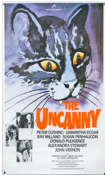
Fig. 9 - Locandina di The Uncanny