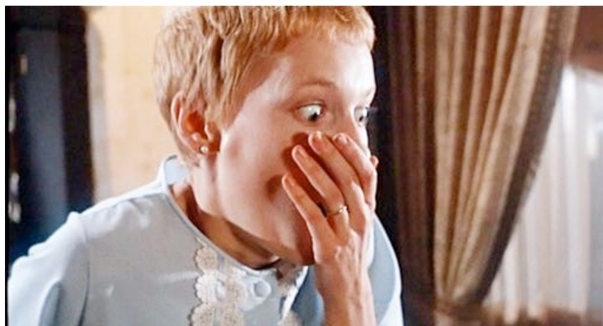
Fig. 3 - Rosemary's Baby (Roman Polanski 1969), la reazione di Rosemary alla vista del nascituro

Rosemary's Baby (Roman Polanski 1968) è un caso lampante: una giovane coppia si trasferisce in un lussuoso palazzo di New York, lei rimane incinta, e – almeno restando sul piano della manifestazione – il suo bimbo ancora in grembo si fa medium del demonio in seguito all'intervento di una coppia di vicini satanisti e del marito a loro aggregatosi. Scendendo più nel profondo le specificità formali del film di Polanski consentono un'interpretazione psicologica piuttosto stimolante: il bimbo non è mai stato posseduto da alcunché e la sua devianza verso il maligno è unicamente frutto di uno stato paranoide della madre, fin dall'inizio “wittingly imprisoned inside a space whose walls conceal incongruous objects and threatening others” (Mamula 2012, p. 185). In effetti di isotopie a supporto di questa seconda interpretazione ve ne sono in quantità nel film, che vede le “paranoid anxieties [...] associated with a third person” (Alizade 2006, p. 138), a giustificare il “delirio demoniaco” (Mastronardi 2005, p. 55) della povera Rosemary Woodhouse.