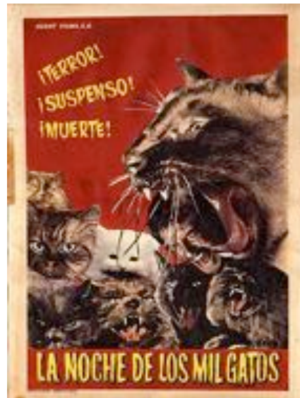
Fig. 10 - Locandina di La noche de los mil gatos