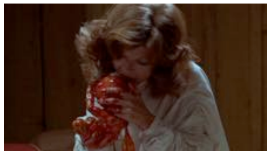
Fig. 6 - Mama (Andres Muschietti 2013), dettaglio del tea- Fig. 7 - The Brood (David Cronenberg, 1979), screenshot ser poster

La diversità intrinseca del cucciolo umano rispetto all'adulto, seppur maggiormente declinata in termini orrifici, a volte diviene anche oggetto di rappresentazioni al di là del cinema del terrore, più tese al metafisico o al trascendente. Caso seminale è il feto astrale di Stanley Kubrick ( 2001: Odissea nello spazio , 1968), sulla cui simbologia si sono spesi fiumi d'inchiostro, capaci di tratteggiare le ipotesi ermeneutiche più disparate pur sempre riconducendo l'interpretazione a un unicum : egli è qualcosa di misterioso, ineffabile, che tuttavia c'è. Il neonato si fa così mediazione atta a rappresentare l'irrappresentabile, esso simboleggia (o rappresenta) qualcosa, che va al di là della sua referenzialità. Semioticamente è il prototipo ideale di segno agostiniano, qualcosa che sta per qualcos'altro. Il problema di fondo sta proprio nell'alterità che esso tenta di fissare, poiché questa è situata in zone fuori fuoco della semiosfera. L'intento di Kubrick è infatti quello di fornire una figurazione del ciclo dell'umanità dalla sua nascita alla sua fine (o al suo rinnovo), e tale ambizioso obiettivo non può che scontrarsi con le zone buie dell'irrappresentabile, che è in fondo l'oggetto nascosto della nostra trattazione: