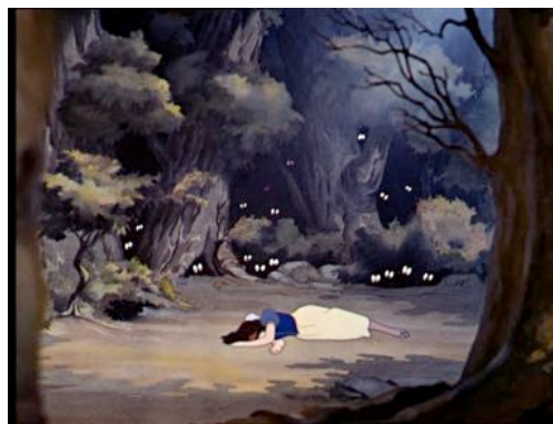
Fig. 5 - Snow White and the Seven Dwarfs (David Hand, 1937), screenshot