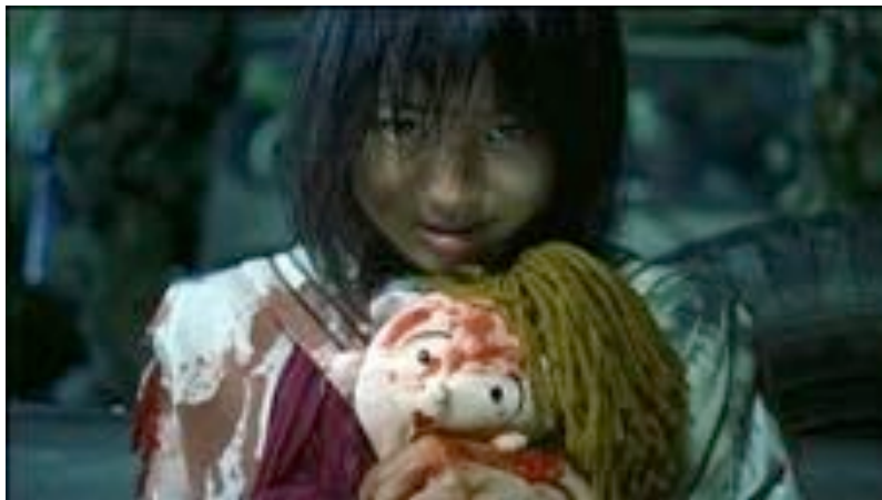
Fig. 13 - Battle Royale (Kinji Fukasaku 2000), screenshot

che con amarezza racconta alcuni giorni dell'estate di un gruppo di ragazzi che devono affrontare i problemi della vita e che non finirà con il tipico lieto fine. Sul lato animale si possono citare a titolo esemplificativo film come Hachiko – Il tuo migliore amico ( Hachi: A Dog's Tale , Lasse Hallström 2009), che di fatto tratta il tema del lutto dal punto di vista di un animale che perde il suo padrone, o Io & Marley ( Marley & Me , David Frankel 2008), che introduce nella narrazione un tema solitamente taboo, cioè quello del cucciolo di cane che una volta fattosi adulto e cresciuto con una famiglia di umani muore. Così, pare, l' illusione cinematografica funge da contraltare a quella che si potrebbe definire come illusione ideologica (Žižek 1989), mostrando il percorso narrativo che conduce a quest'ultima, o al rifiuto di questa (si pensi al finale quasi-suicida del primo episodio di Hunger Games ), ai vantaggi che da essa derivano, ma al disagio esistenziale che essa comporta, come dimostrano infine gli occhi dell'ultima sopravvissuta alla Battle Royale, la cui cucciolosità è emblematicamente dal pupazzo che stringe a sé, in un'interpellazione carica di rimandi simbolici.